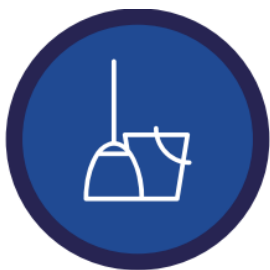
Desinfectar los objetos que usas con frecuencia