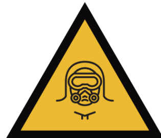
Zona de desinfección